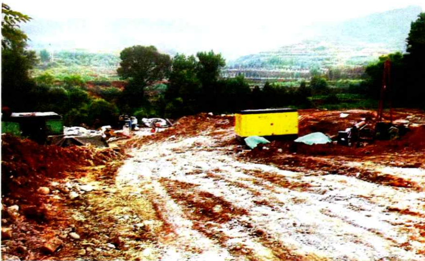
照片 3 现场概貌照片