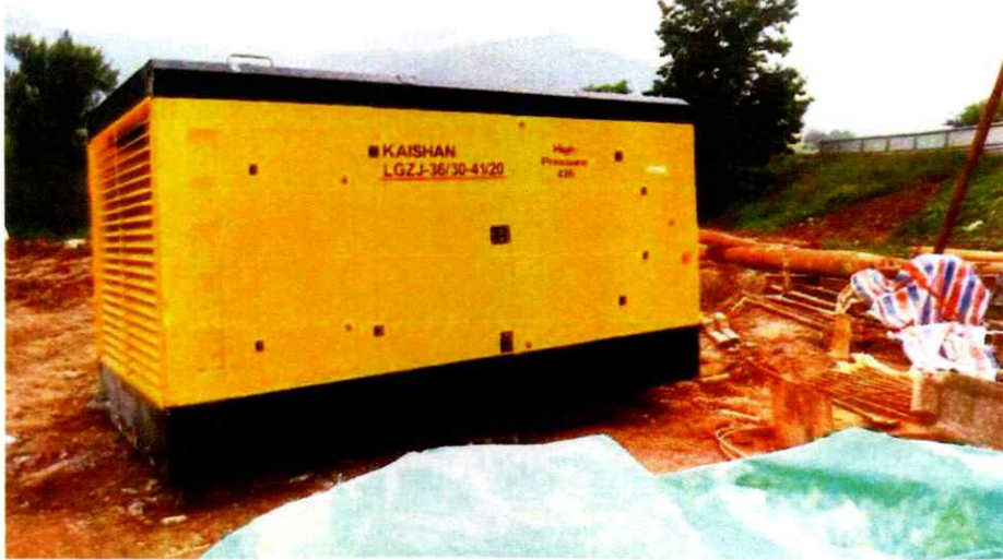
照片 4 空压机现场照片