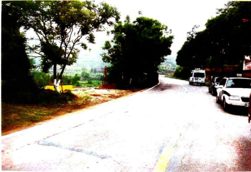
照片 2 现场方位照片