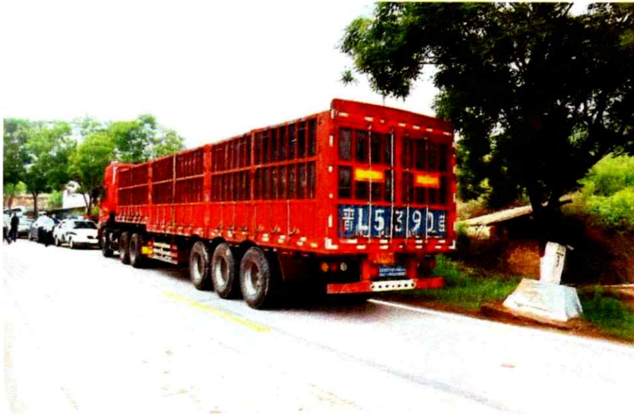
照片6 现场半挂车照片