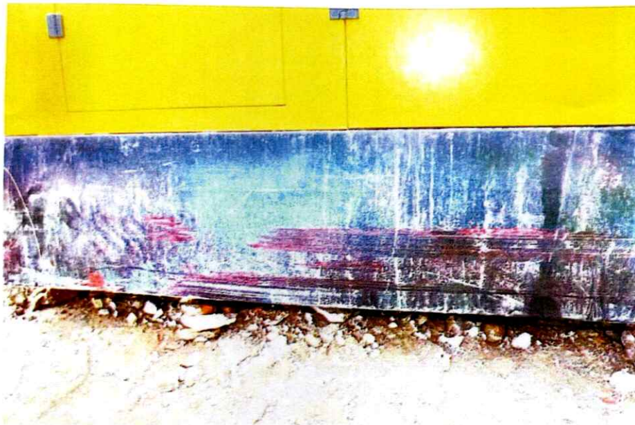
照片 5 空压机右侧底部擦蹭痕迹照片