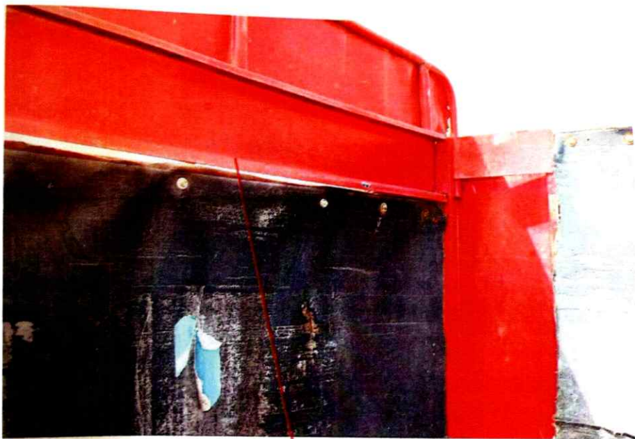
照片7 后门上方第一横梁上有血迹和少量毛发